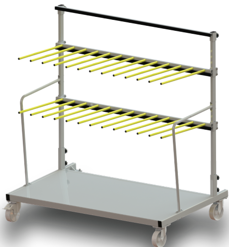
SOUL LIGHT Z

Einseitiger (Z) oder zweiseitiger (2Z) Wagen für den vertikalen Transport von Profilen. Trennelemente aus Stäben mit Kunststoffummhüllung. Wagengestell aus Metallblech. Vier gelenkte Polyamid-Rollen, davon zwei mit Bremse Durchmesser 160 mm. Oberfläche: RAL 7035. Länge: 1800 mm. Breite: 1000 mm. Höhe: 1800 mm.. Wagentragfähigkeit von 400 kg verteilt auf zwei Ladeseiten.