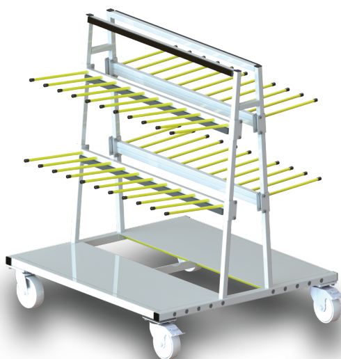
SOUL LIGHT 2Z